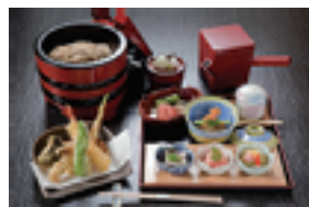
そば焼石という新しいスタイルのお店です。