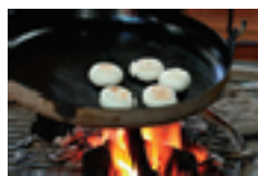
どれも正解!聞く時間によってちがうんだよ。