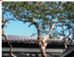
木の肌が滑らかなので、猿も滑ることから、「猿滑」