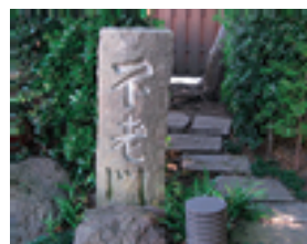
奥には「ほころ」もあるよ。