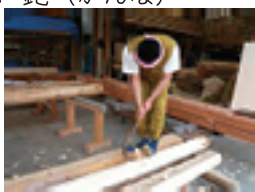
手斧は振った刃が、自分の方へ向かってくるので、かなりの熟練を必要とする道具です。