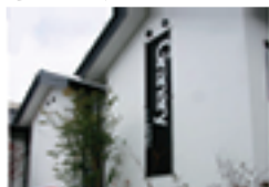
蔵が多かったこの地域にふさわしい名前だね。