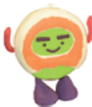
なすの おやきだよ