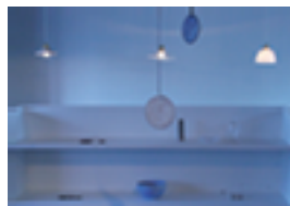
9月にリニューアルしたギャリィ夏至もよろしく。